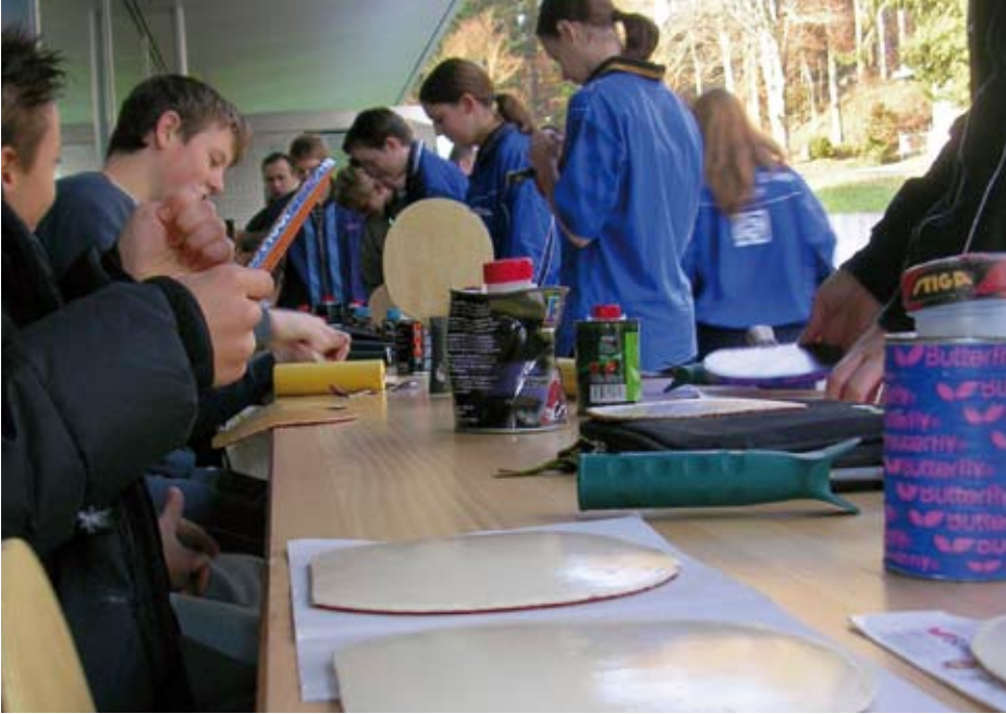
Wenn überhaupt, nur noch vereinzelt zu sehen: Spieler beim Frischkleben. Spectacle bientôt révolu: un pongiste en train de gommer sa raquette.

bis zum 1. September 2008 mit den herkömmlichen Klebern spielen. Für die Wettkämpfe in der Schweiz (RLT, Elite SM) müsste er jedoch auf die neuen Mittel greifen: «Ich bin mir noch nicht ganz sicher, werde aber vermutlich mit den neuen Klebern spielen. Der Nachteil ist, dass ich dann